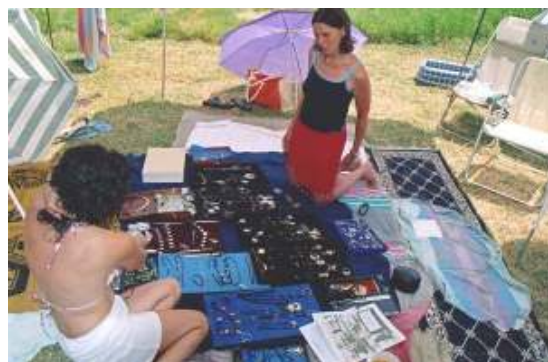
Dans un camping en Corse