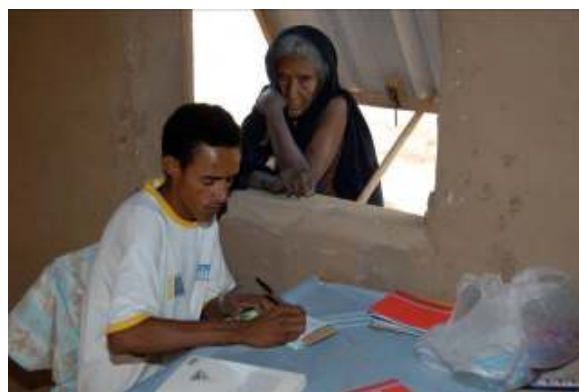
Un guichet d'accueil a été installé à la fenêtre de la salle des soins