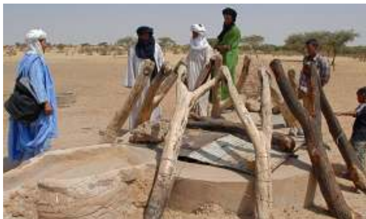
Le puits, prêt pour l'exhaure animale en 08/09, se prépare pour l'exhaure mécanique au 2 ème semestre 2009