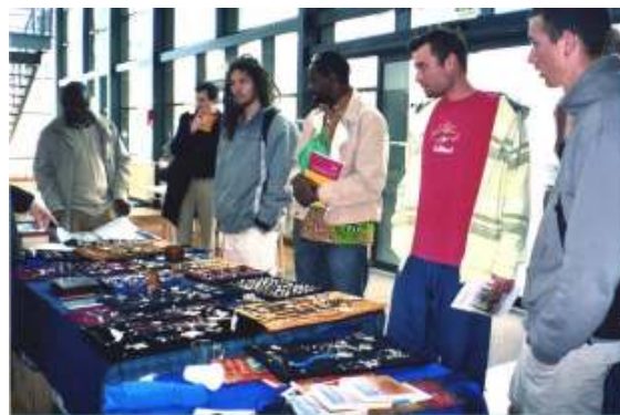
A la fête des Partenaires à l'Institut de Géographie Alpine