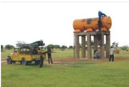
Mise en place de la citerne

Le premier remplissage de la citerne de 10 000 litres s'est fait en moins de 3 heures fin octobre 2008. Le tout doit être opérationnel au plus tard dans deux ou trois semaines lorsque l'eau des mares toutes proches sera épuisée.