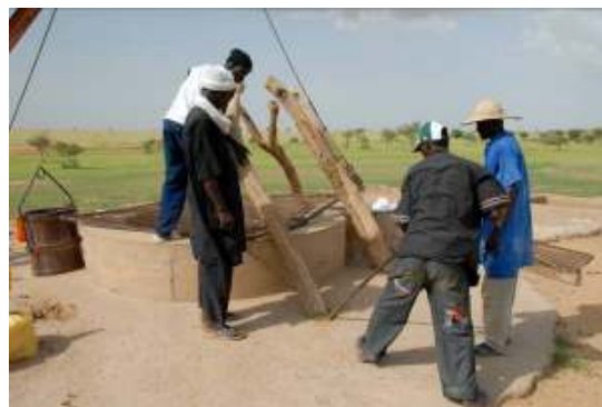
Retrait des fourches pour l'exhaure animale