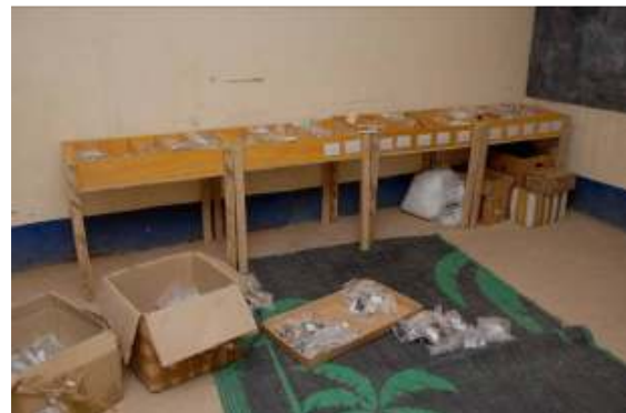
Installation en cours du nouveau magasin