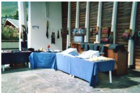
Sur le parvis d'une église avec nos amis suisses près de Martigny