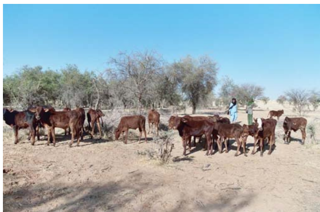
Les premiers veaux de la ferme

Pour ceux qui voudraient encore participer, la souscription n'est pas close : bulletin ci-après