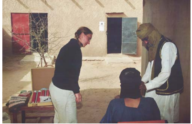
Analyse de vue à Chin Fangalan