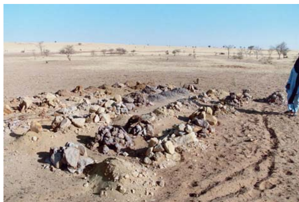
Un échantillon de terre pour chaque mètre

(1) Voir ISALAN n° 14 de novembre 2006 – page 2