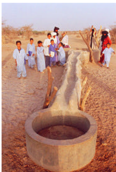
La « goulotte » vers un abreuvoir